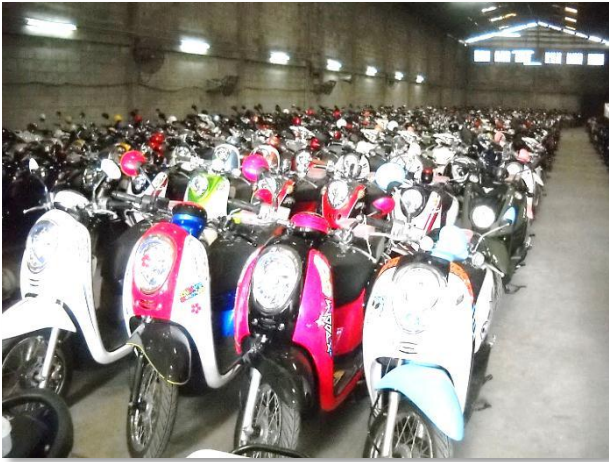
รูปภาพ : เตรียมรถขาย.สำหรับการประมูล