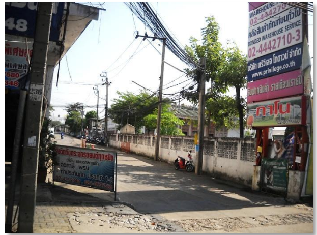
รูปภาพ : ทางเข้าโกดัง (สถานที่ประมูล)