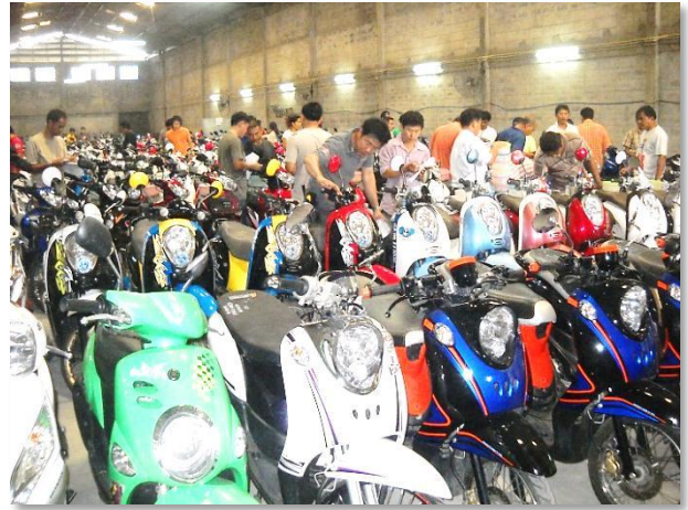
รูปภาพ : ตรวจสอบสภาพรถประมูล