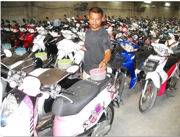
รูปภาพ : ตัวอย่างการเสนอราคา