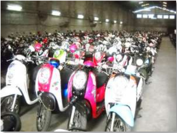
รูปภาพ : เตรียมรถขาย.สำหรับการประมูล