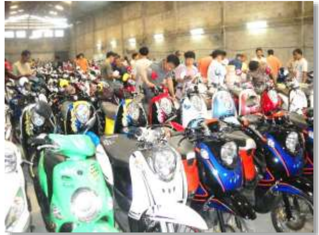
รูปภาพ : ตรวจสอบสภาพรถประมูล