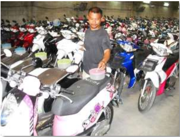
รูปภาพ : ตัวอย่างการเสนอราคา