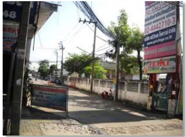
รูปภาพ : ทางเข้าโกดัง (สถานที่ประมูล)